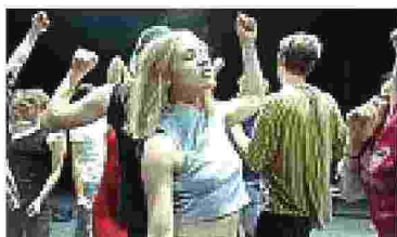
Rave Una scena di «Crowd» di Gisèle Vienne